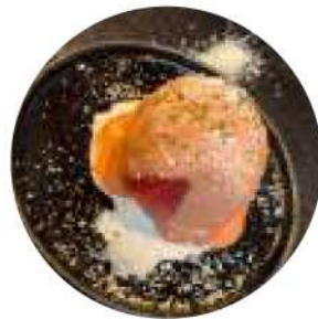
トマトのファルシーサラダ