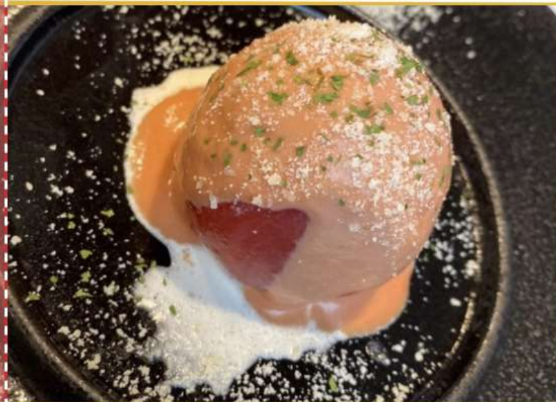
トマトファルシー