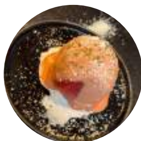
トマトのファルシーサラダ ¥ 650