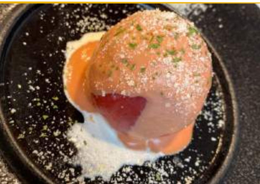
トマトファルシー