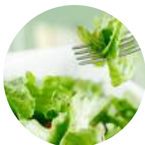
ミニサラダ ¥ 550