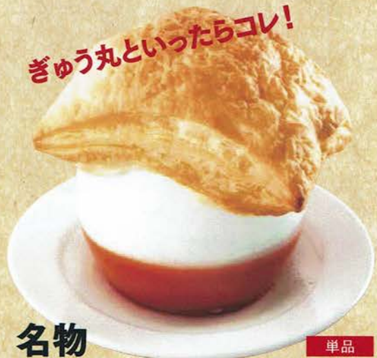
名物 パイ包みスープ 455 单品 (税込 500)