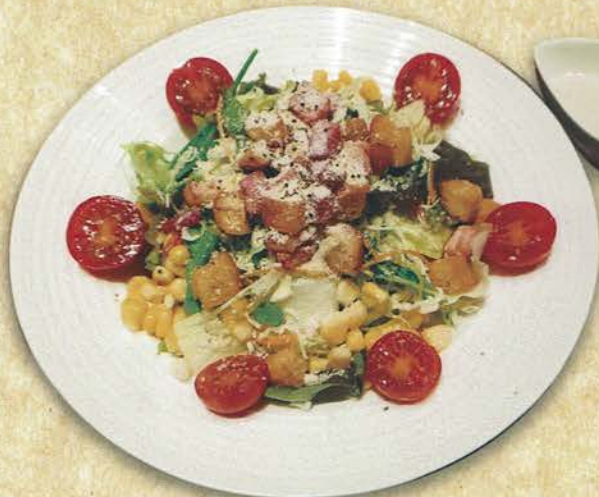
シーザーサラダ 700 (税込 770)