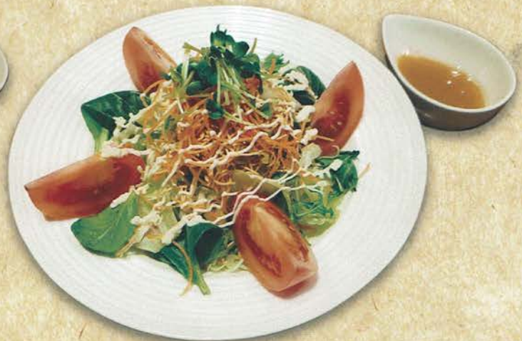
シャキシャキサラダ 555 (税込 610)